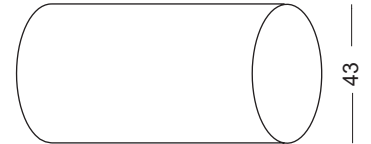
PUSZKA DO WERSJI L